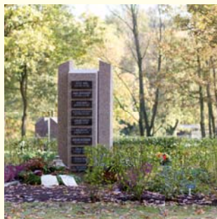
Urnengemeinschaft 2364.86 €