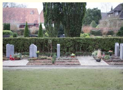
Partnergrab 6674.33 €