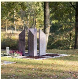
Partnergrab 6674.33 €