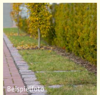
Ohne Abb.: Wahlgrab Urne 180.- € Sarg 330.- €

Ruhezeiten 30 Jahre für 1 Sarg / 20 Jahre für 1 Urne