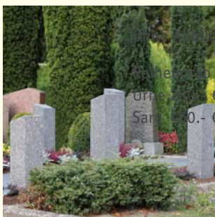
Partnergrab 6658.58 €