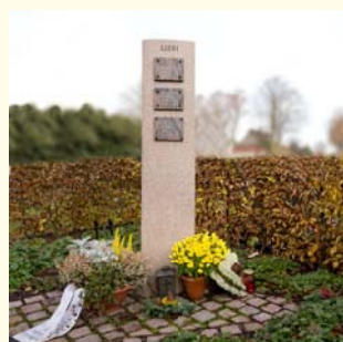
Urnengemeinschaft 1990.- €