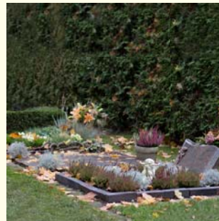
Wahlgrab für 2 Urnen 560.- € für 2 Säрге 600.- €