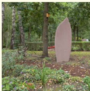
Bestattung im Wäldchen Urnengemeinschaft 2868.08 €

Ohne Abbildung: Reihengrab Urne 280.- € / Sarg 450.- €