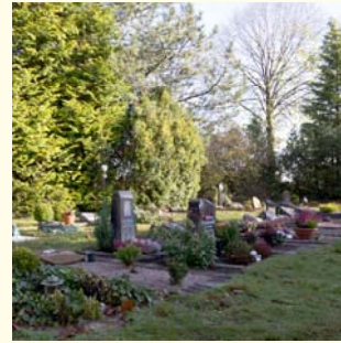
Wahlgrab für 2 Grabstellen Urne 340.- € / Sarg 730.- €