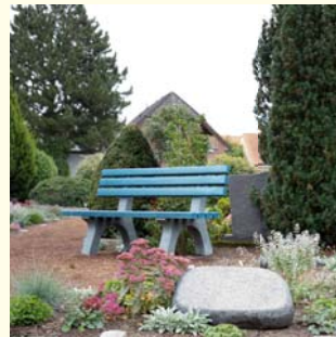
Naturruh „Mosegarten“ 1 Pers. 3639.50 € / 2 Pers. 5368.26 €