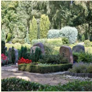
Wahlgrab Urne 560.- € Sarg 600.- €