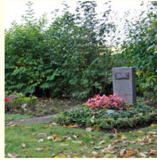
Urnengemeinschaft 2364.86 €