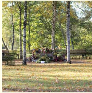
Anonymes Grab Urne 410.- € Sarg 540.- €