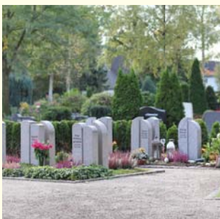
Partnergrab 6674.33 €