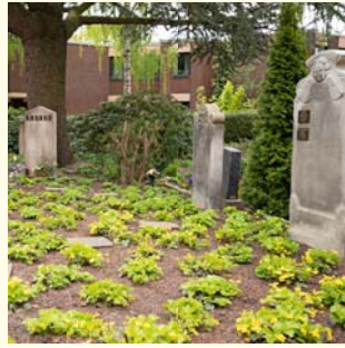
Urnengemeinschaft „Phoebe“ 1 Pers. 2000.- € / 2 Pers. 2500.- €