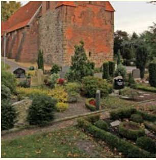
Wahlgrab 405.- € für 2 Urnen und 1 Sarg