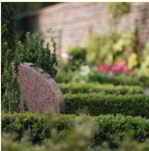
Wahlgrab für 2 Urnen 270.- € für 2 Urnen und 1 Sarg 405.- €