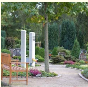
Urnengemeinschaft 2364.86 €