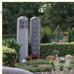
Urnengemeinschaft 2608.99 €