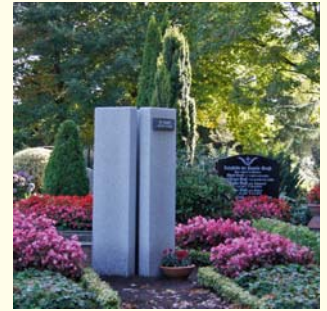
Urnengemeinschaft 2721.01 €