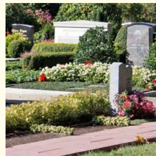
Partnergrab 7706.87 €

Ruhezeiten 30 Jahre für 1 Sarg / 25 Jahre für 1 Urne