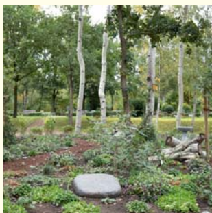
Bestattung im Wäldchen 2 Pers. 5054.96 €