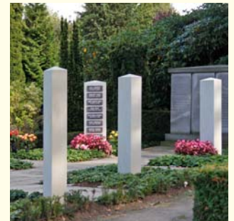
Urnengemeinschaft 2364.86 €