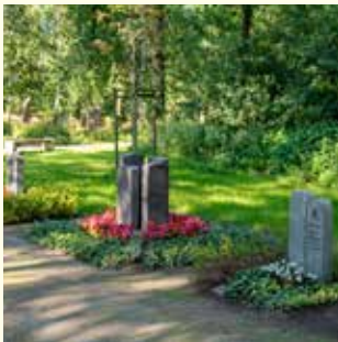
Partnergrab 6800.33 €