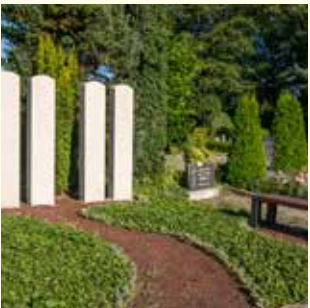
Urnengemeinschaft 2721.68 €