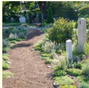
Naturruh „Esther“ 1 Pers. 5496.23 € / 2 Pers. 6501.08 €