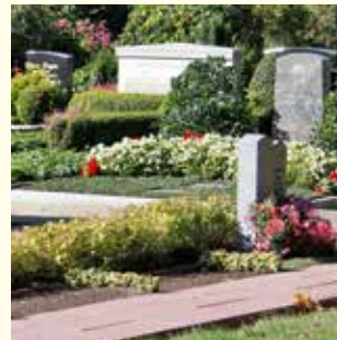
Partnergrab 7735.22 €

Ruhezeiten 30 Jahre für 1 Sarg / 25 Jahre für 1 Urne