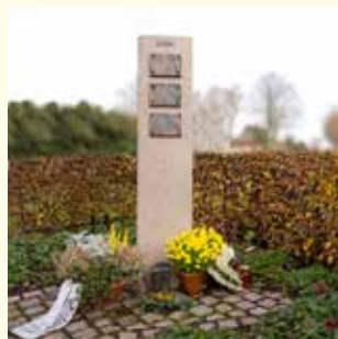
Urnengemeinschaft ab 2376.- €