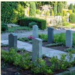
Partnergrab 6810.83 €