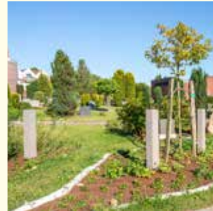
Naturruh „Yara“ 1 Pers. 3353.70 € / 2 Pers. 5149.73 €