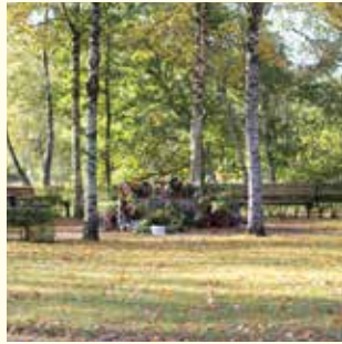
Anonymes Grab Urne 490.- € Sarg 820.- €