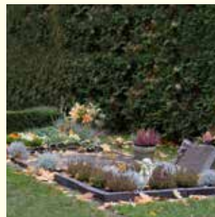
Wahlgrab für 2 Urnen 680.- € für 2 Säрге 720.- €