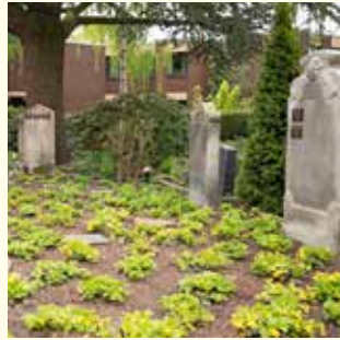
Urnengemeinschaft „Phoebe“ 1 Pers. 2800.- € / 2 Pers. 4200.- €