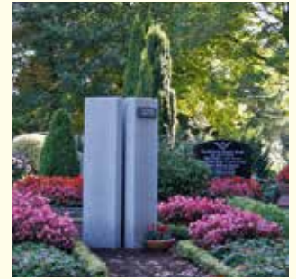
Urnengemeinschaft 2749.36 €