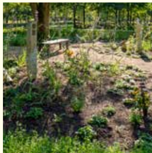
Bestattung im Wäldchen Urnengemeinschaft 2931.08 €

Ohne Abbildung: Reihengrab Urne 340.- € / Sarg 550.- €