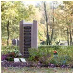
Urnengemeinschaft 2427.86 €