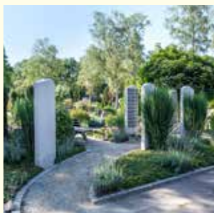
Urnengemeinschaft 2427.86 €