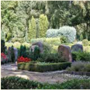
Wahlgrab Urne 680.- € Sarg 720.- €