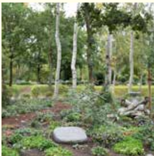
Bestattung im Wäldchen 2 Pers. 5180.96 €