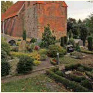
Wahlgrab 500.- € für 2 Urnen und 1 Sarg