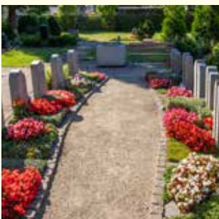
Partnergrab 6800.33 €