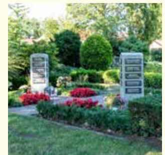
Urnengemeinschaft 2427.86 €