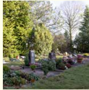
Wahlgrab für 2 Urnen 340.- € / 1 Sarg 730.- €