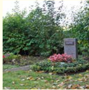
Urnengemeinschaft 2427.87 €