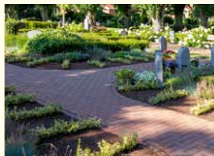
Partnergrab 6800.33 €